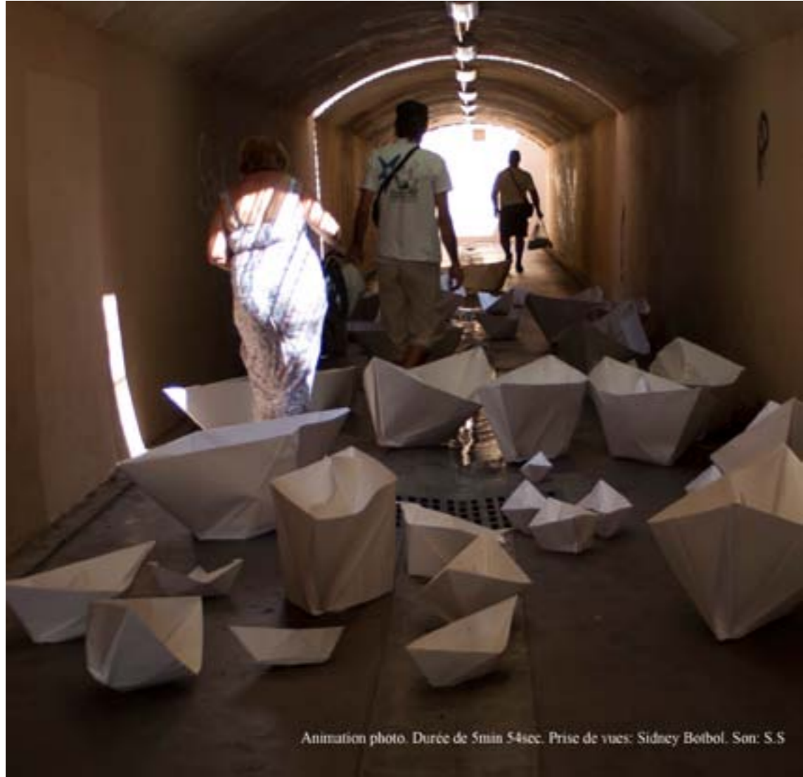
Animation photo. Durée de 5min 54sec. Prise de vues: Sidney Boitbol. Son: S.S