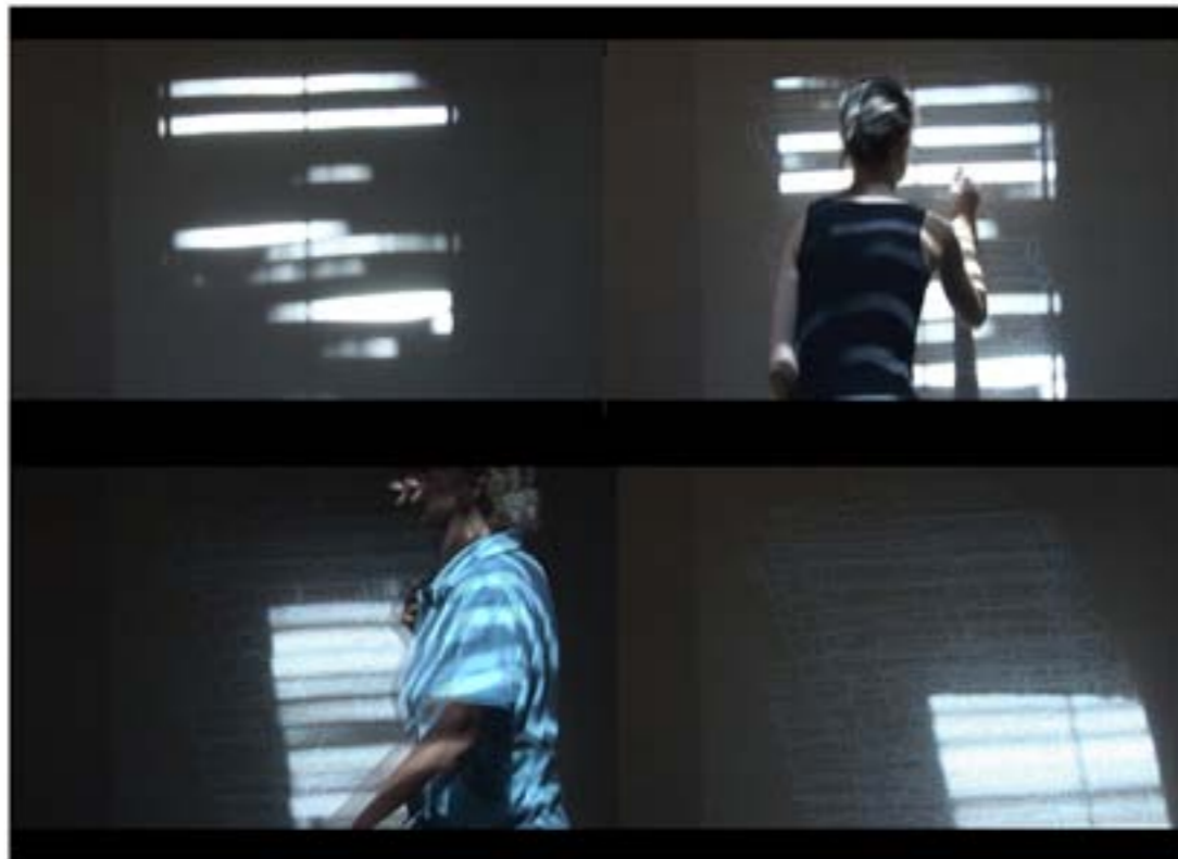
Captation vidéo de 1h 04min. Enregistrement: Sidney Botbol