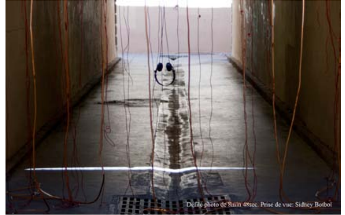
Défilé photo de 8min 48sec.