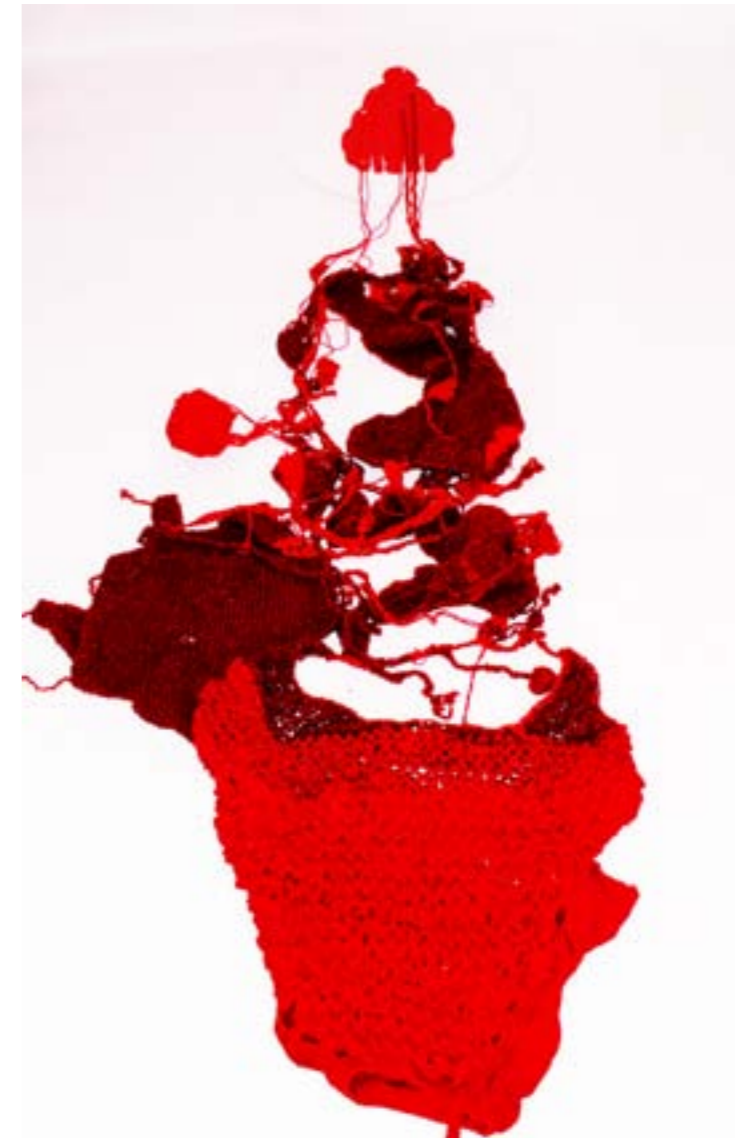
Installation Liens persistants, "work in progress".